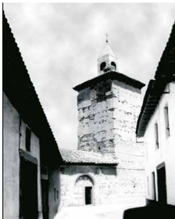
Vista de la Torre del Reloj desde la calle la Plata AÑO 1963

Al mismo tiempo que se edificaba la Iglesia, se procedió a la reunión o agrupamiento de los habitantes de los tres barrios, San Lázaro, Santa Lucía y San Pelayo, situándolos en lugares próximos a la misma, pero no mezclados. Así se colocaron los moradores de San Lázaro al norte de la citada Iglesia, ocupando los suelos de los huertos cercados que pertenecieron a la familia Lázaro de Diego, en los que