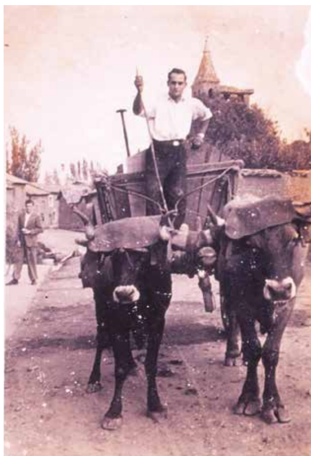
Carro tirado por bueyes, calle Doctor Vélez

Como esta entrega de frutos se vino haciendo de forma ininterrumpida entre los años 1165 a 1230, a que se extendieron los reinados de Fernando II y de su hijo Alfonso IX, el nombre se consolidó en dicha forma y así se le llamó durante todos estos años. Pero en el año 1230, como veremos en el Capítulo siguiente, la Villa fue donada por el Monarca al Obispo de Astorga y al perder esta pertenencia directa del Rey, como dueño del Señorío sobre la misma, dicho nombre de la Villa sufrió sus fluctuaciones, y así en unos documentos