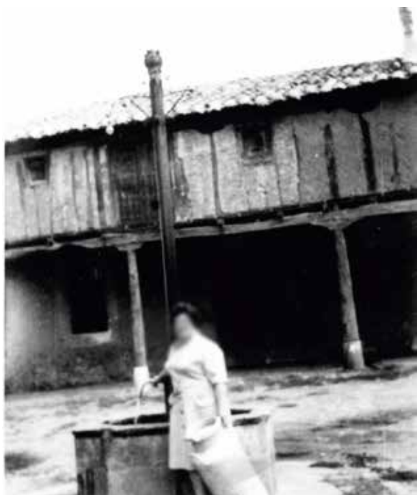
Caño de la Plaza Mayor

Formado así un solo poblado con los 3 barrios existentes, se reguló que sería regida por un Concejo único, formado por los vecinos de las 3 Manidas, existiendo 2 alcaldes y justicia ordinarios, que serían los Jueces para impartir justicia en la vecindad y 3 regidores, designado uno por cada Manida. La competencia de los alcaldes-justicia era muy amplia, pues según se hace constar en la Composición