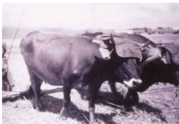
Trillo tirado por bueyes

Cientos de trillos se vendían en las calles, apollados en las paredes y en montones en el suelo. Gente seria que