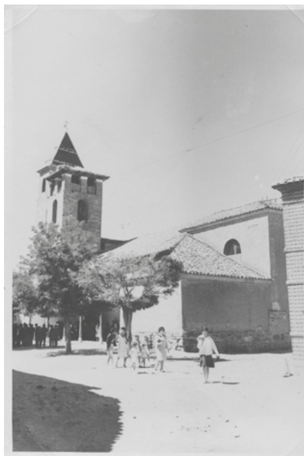
Vista de la Iglesia desde la calle Principal AÑO 1963