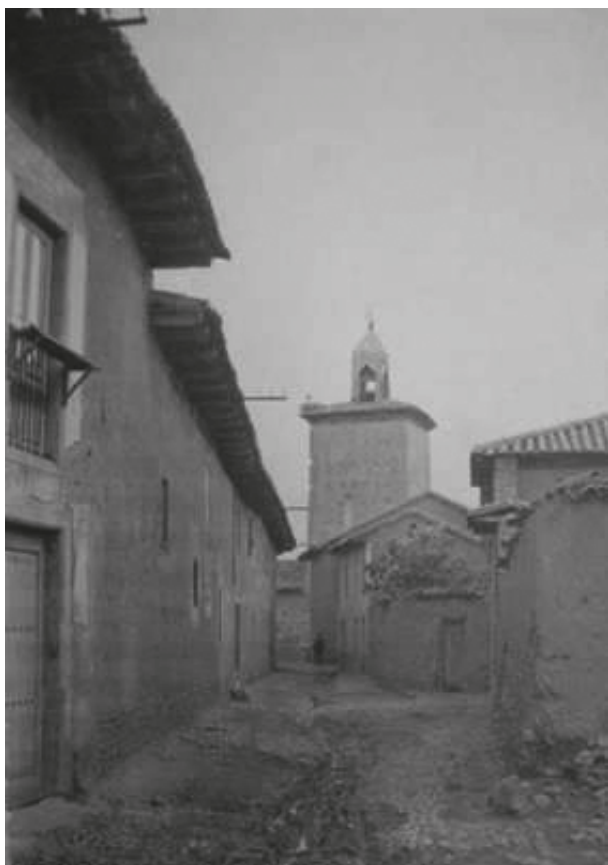
Vista de la Torre del Reloj desde la calle del Reloj AÑO 1920 aprox.

existían diversas calles, los que formaron la Manida de Córdoba. Los de Santa Lucía fueron situados en la calle hoy llamada de Las Escuelas y en plaza de las Eras, formando la Manida de Las Eras, y finalmente a los de San Pelayo o mozarabes los situó en la calle de Caldemoros y en la parte de la calle de la Iglesia, desde Caldemoros hasta donde ahora se halla el Ayuntamiento.