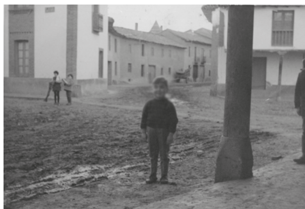
Calle Caldemoros - Plaza Mayor AÑO 1970

todas las casas, que hay entre dicha calle y la Plaza, estaban ocupados por una laguna que se formaba por aguas pluviales, pues es fácil observar que a todo la largo de la carretera, desde donde se situó la Manida Córdoba hasta la actual Iglesia y más adelante, hay un ribazo o “cembo”, que impedía la salida de dichas aguas, y así puede apreciarse que actualmente las aguas de la calle de la Plata y del Reloj las vierten hacia la plaza. Con el transcurso del tiempo se abrió un desagüe a dicha laguna por la actual calle del Norte, bien por las mismas aguas o por obra de los vecinos, y sobre estos terrenos ganados a la laguna se fueron situando casas, y se formaron dos Manidas, llamándose a