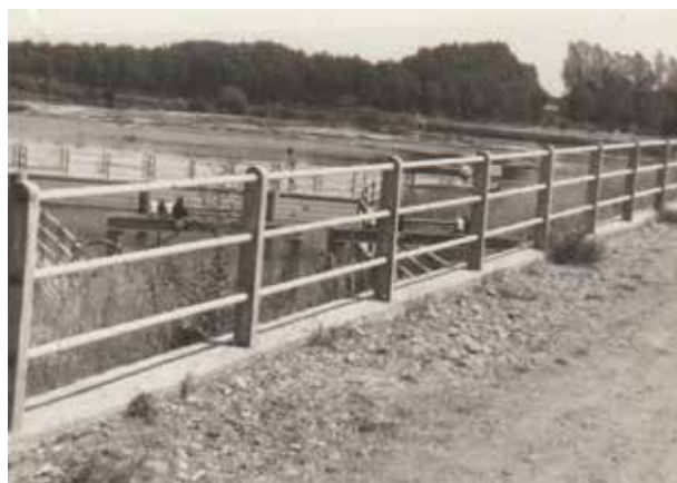
Río Órbigo, 1970

términos de Palazuelo, Gabilanes y Benavides de Órbigo con el de Santa Marina del Rey.